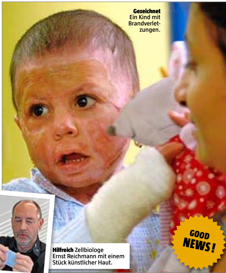
Gezeichnet Ein Kind mit Brandverletzungen.